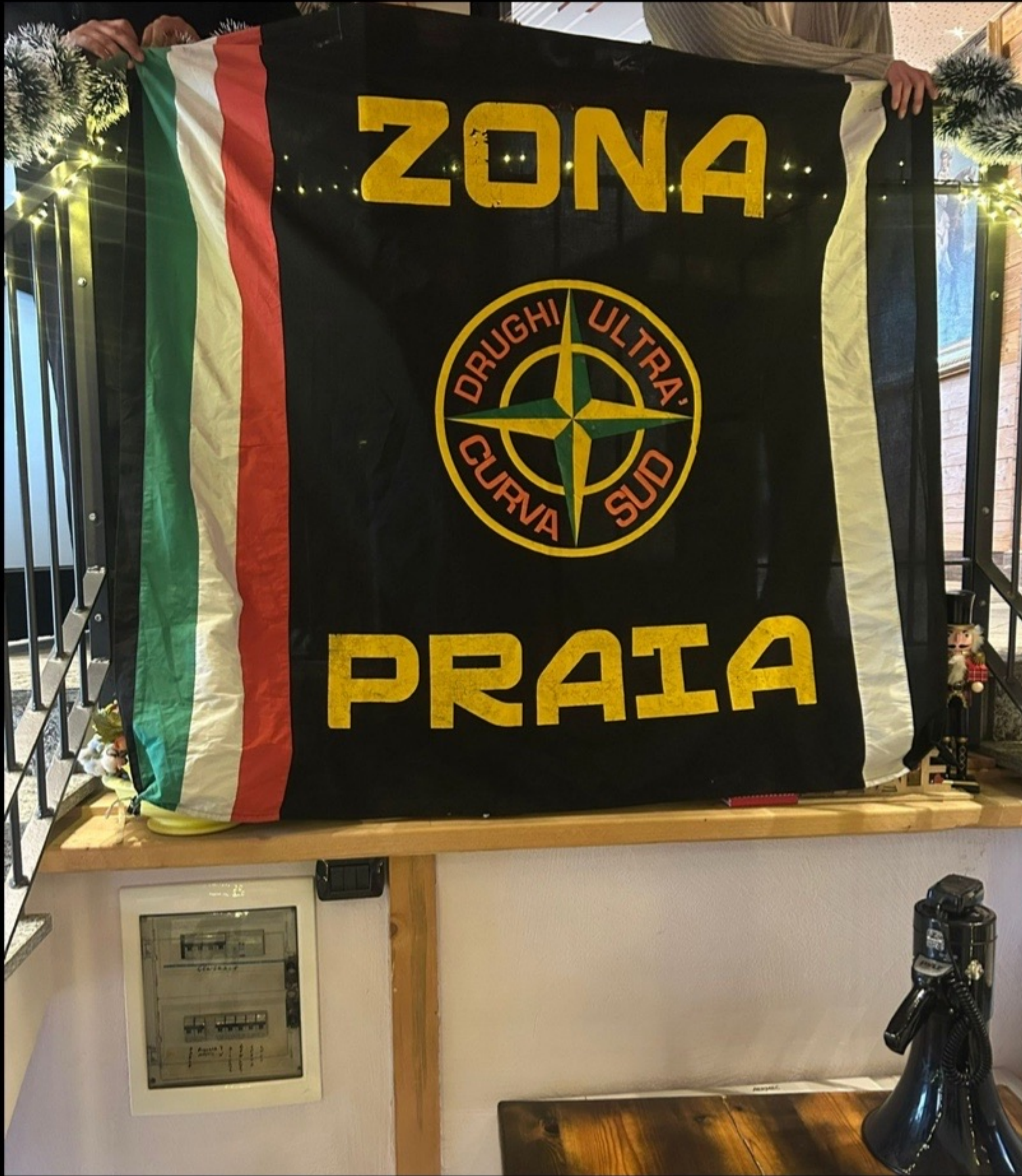
SEZIONE ASTI PRAIA

“COME OGNI ANNO, CI RITROVIAMO PER IL CONSUETO APPUNTAMENTO. UNA GIORNATA PER STARE TUTTI INSIEME E SCAMBIARCI GLI AUGURI DI NATALE”