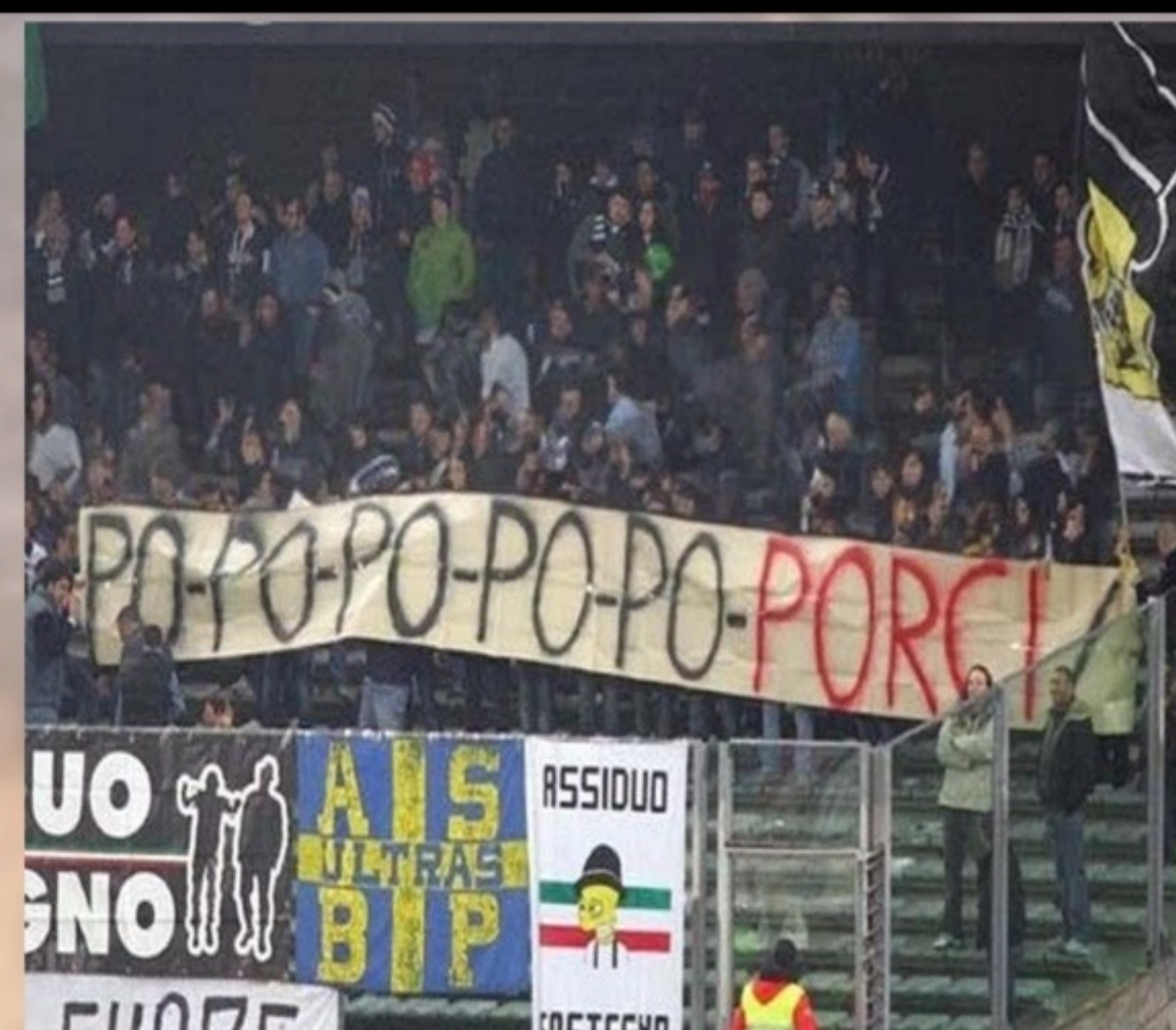
Juventus - Roma 2005/06