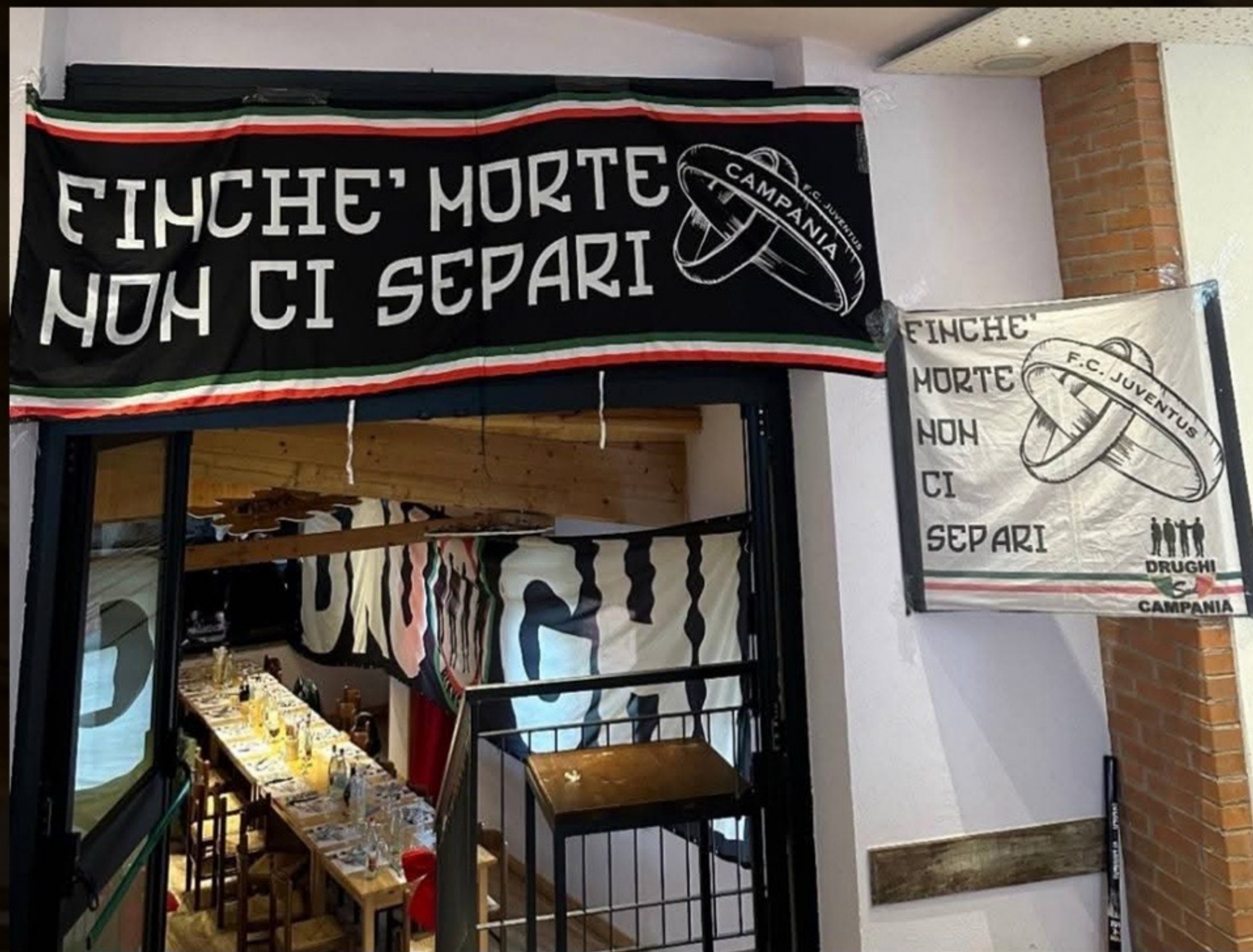
SEZIONE DRUGHI SUD CAMPANIA