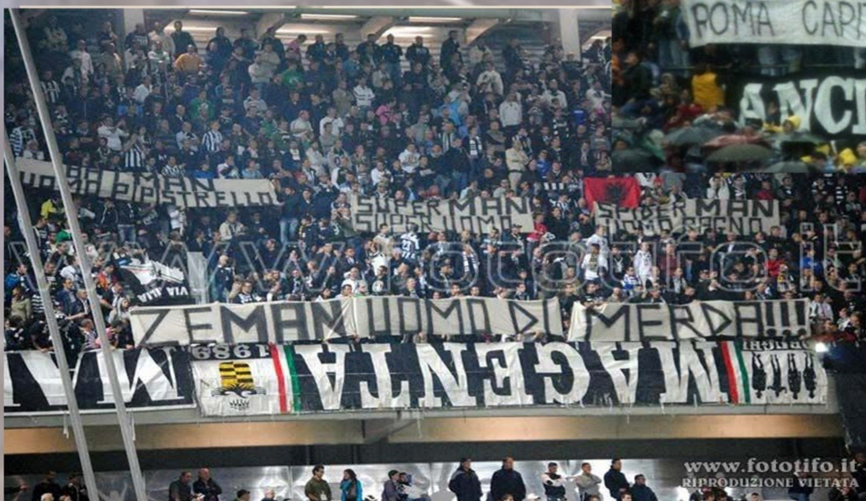
Juventus - Roma 12/13 striscione contro Zeman