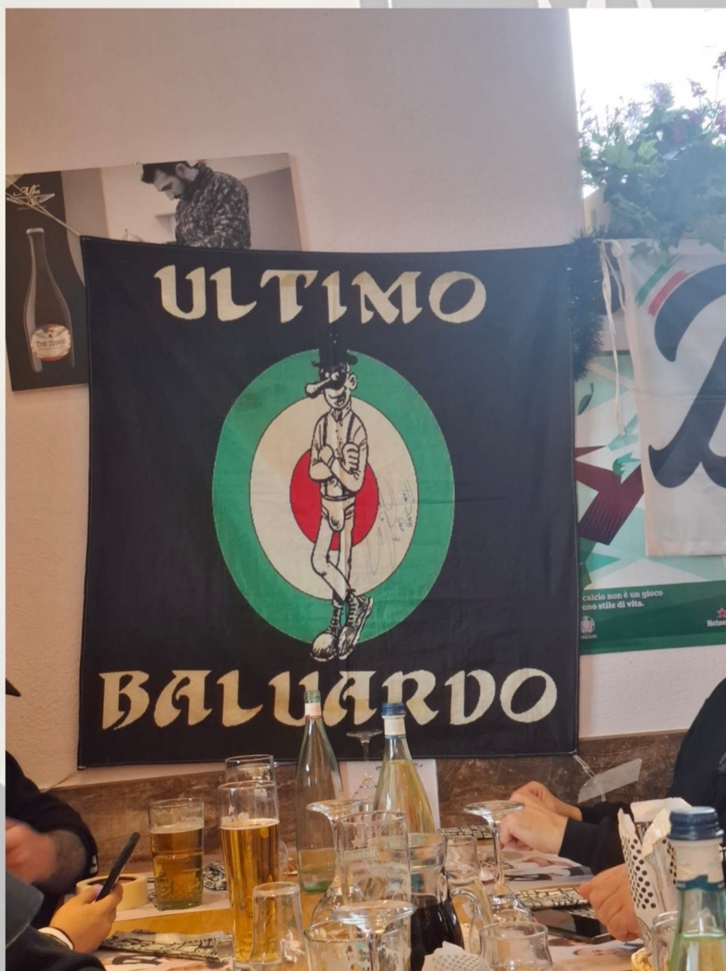
SEZIONE ULTIMO BALUARDO