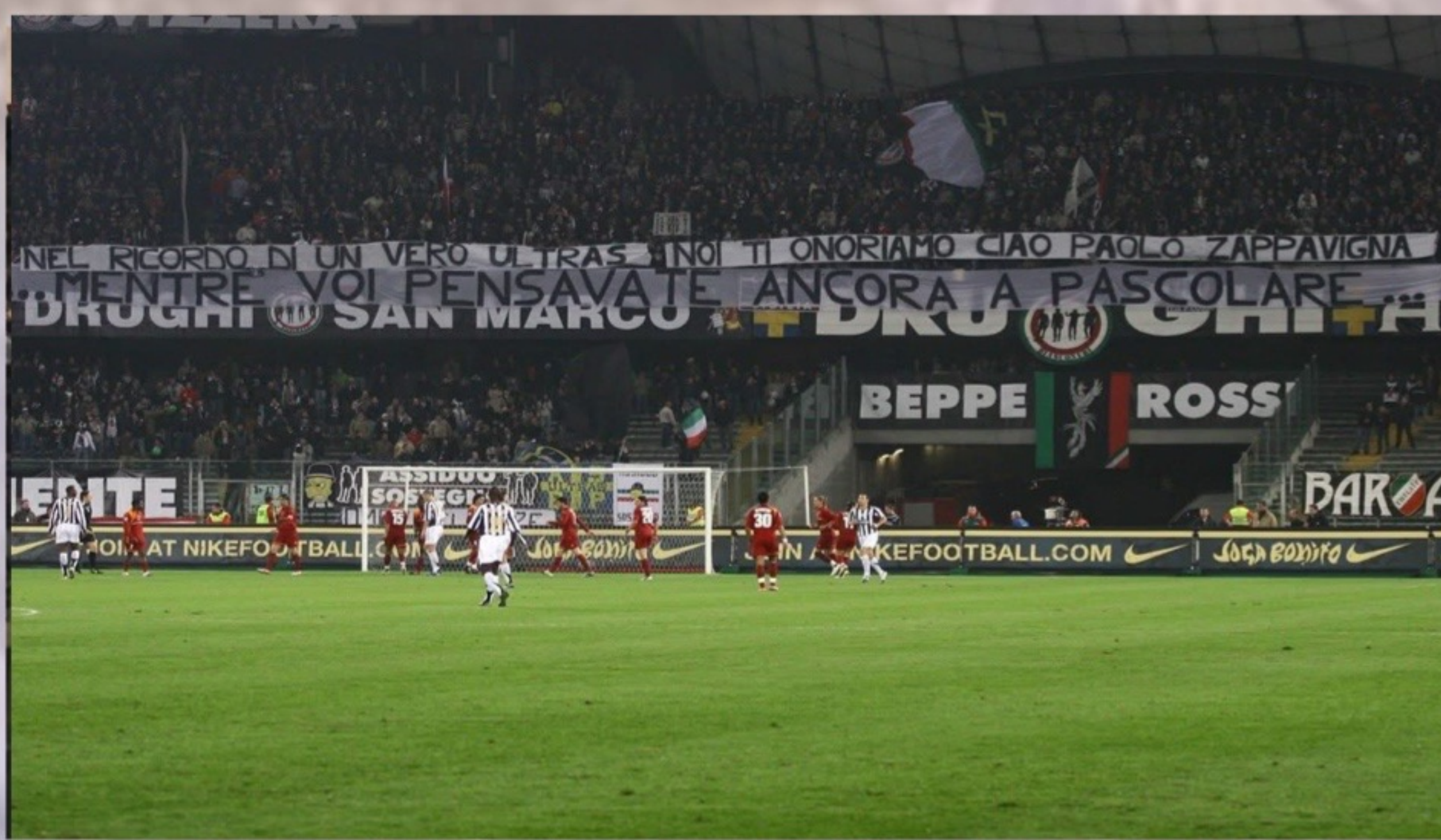
Juventus - Roma 2005/06

"Striscione per Cristian De Cupis, detenuto morto in circostanze poco chiare nell'ospedale di Viterbo"