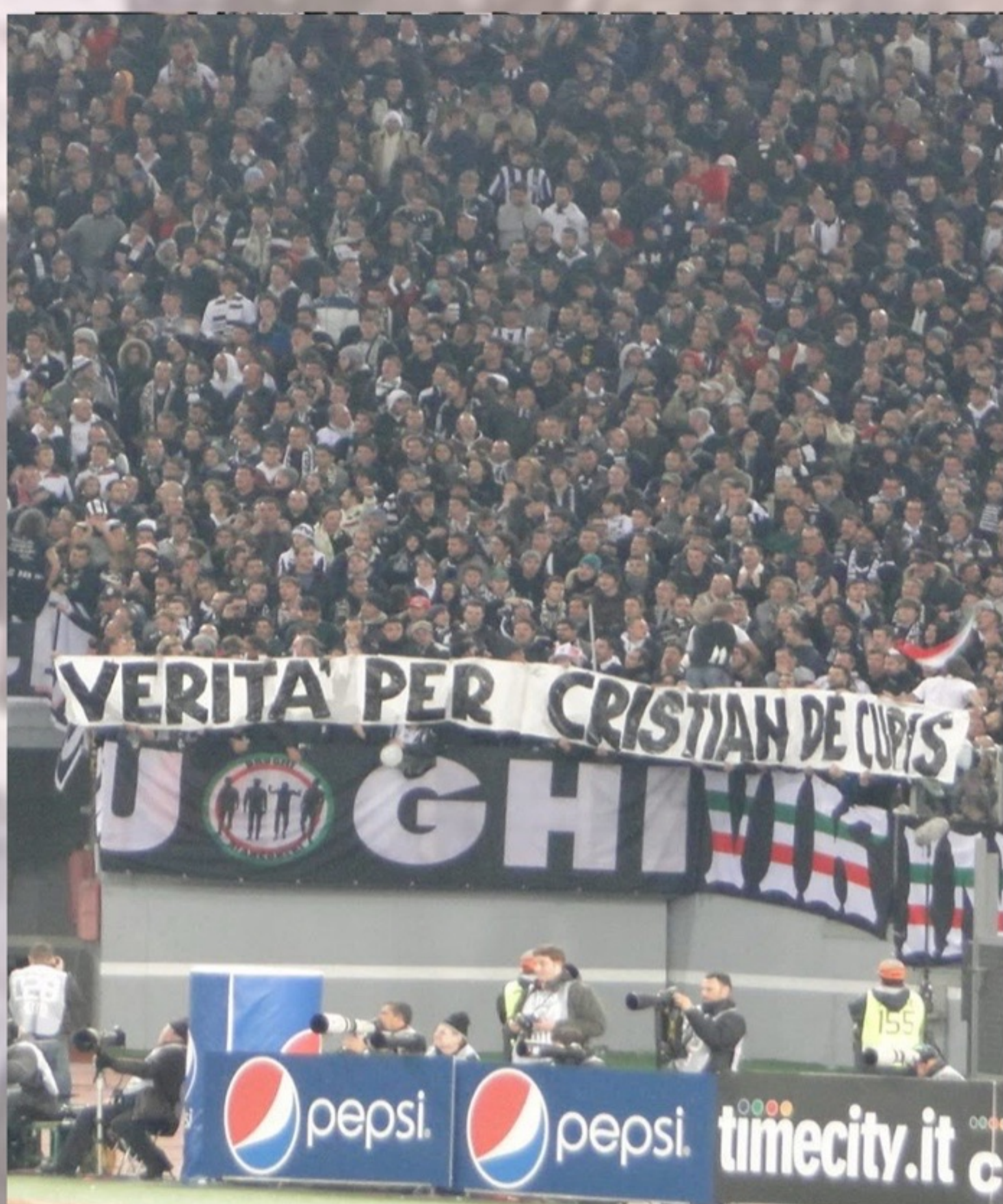
Roma - Juventus 2011/12

"Striscione per Cristian De Cupis, detenuto morto in circostanze poco chiare nell'ospedale di Viterbo"