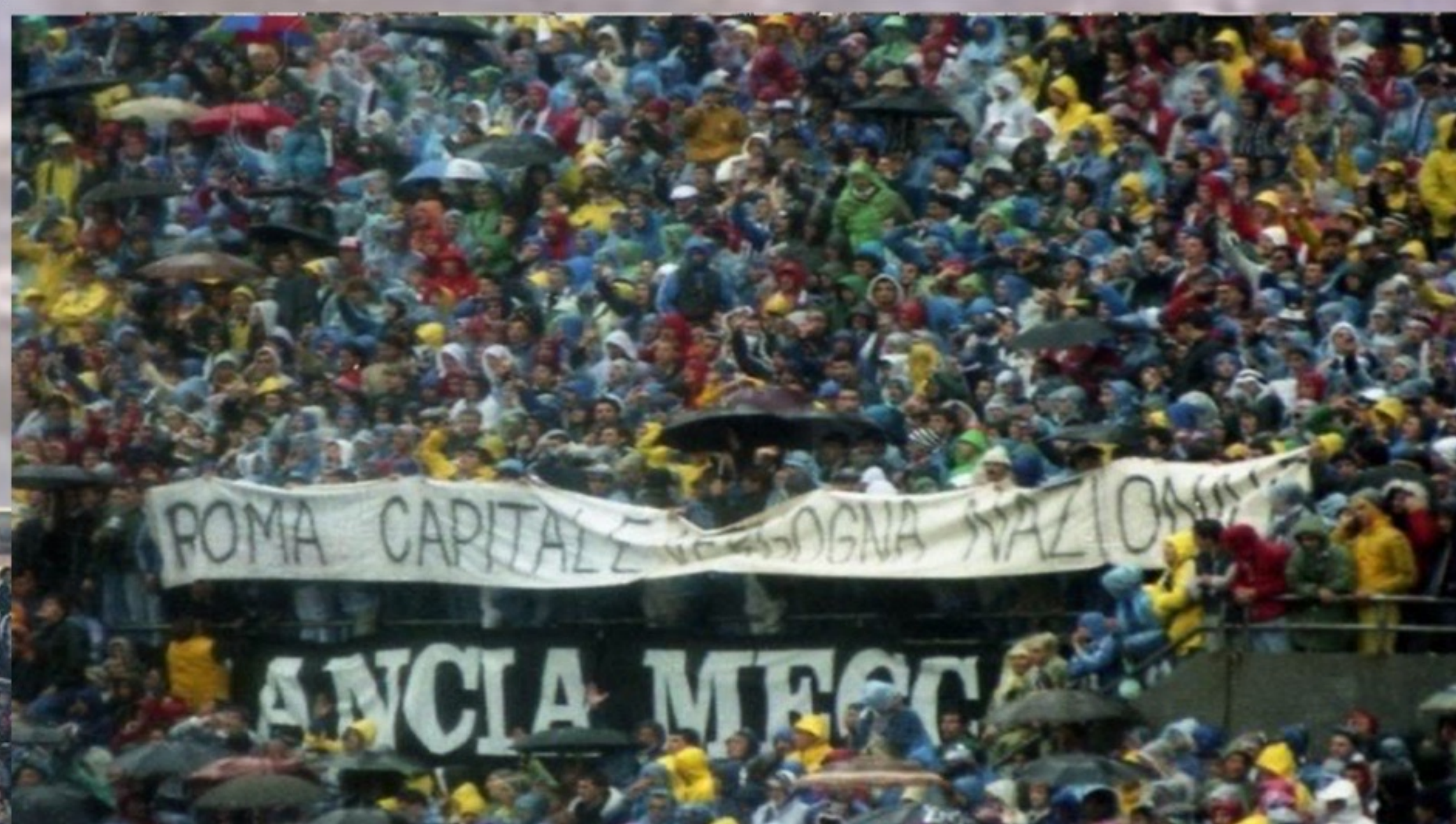
Juve - Roma 87/88 "Roma Capitale Vergogna Nazionale"

"striscione in ricordo di Paolo Zappavigna"