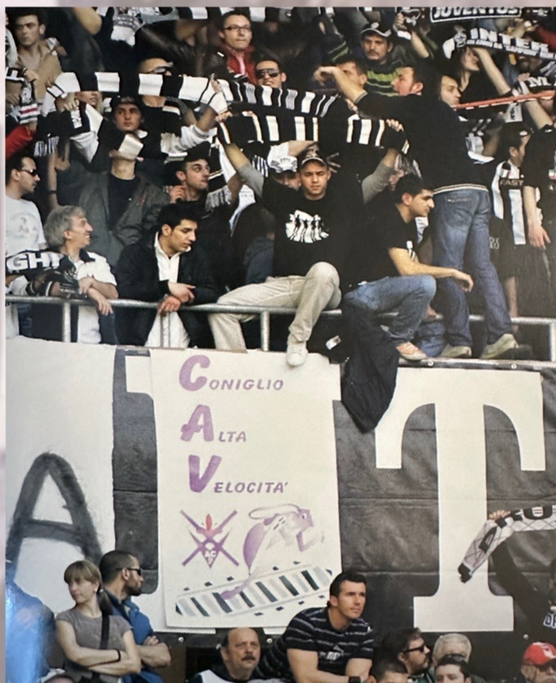
JUVENTUS - FIORENTINA 2/03/2008