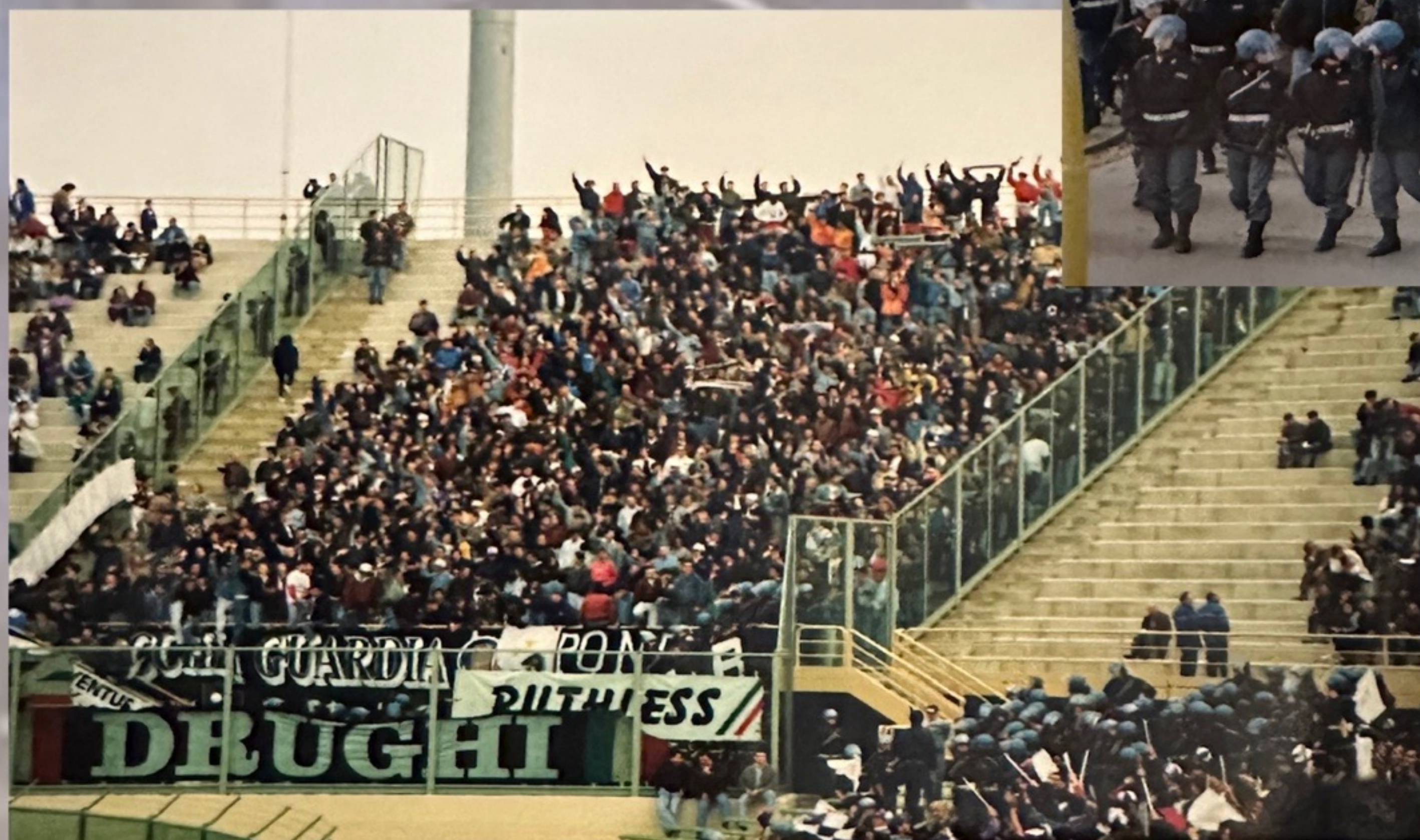
FIORENTINA - JUVENTUS 1990/91