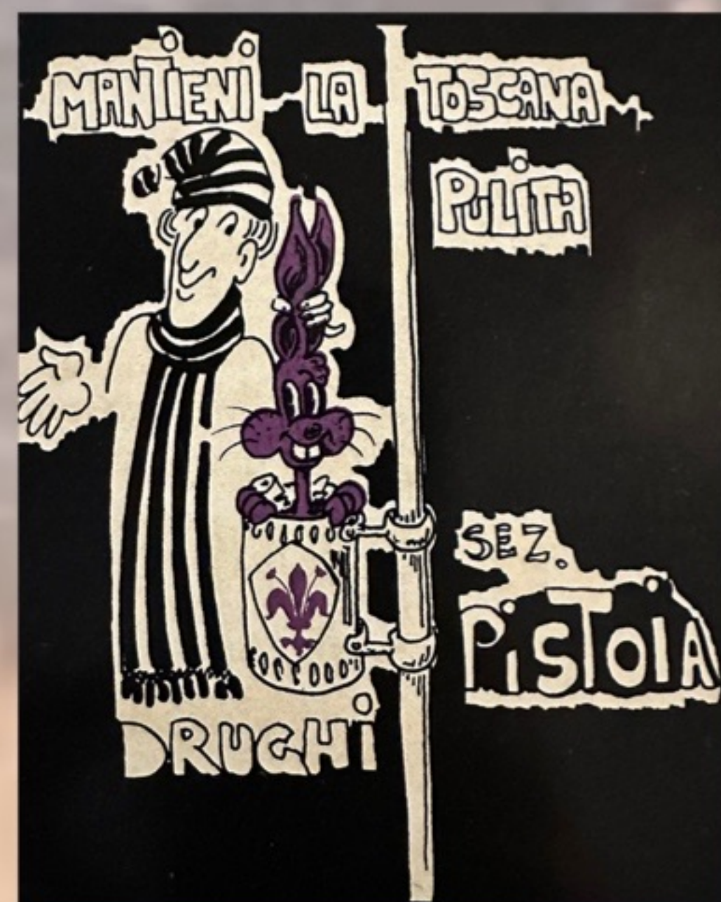
ADESIVO ANNI 90