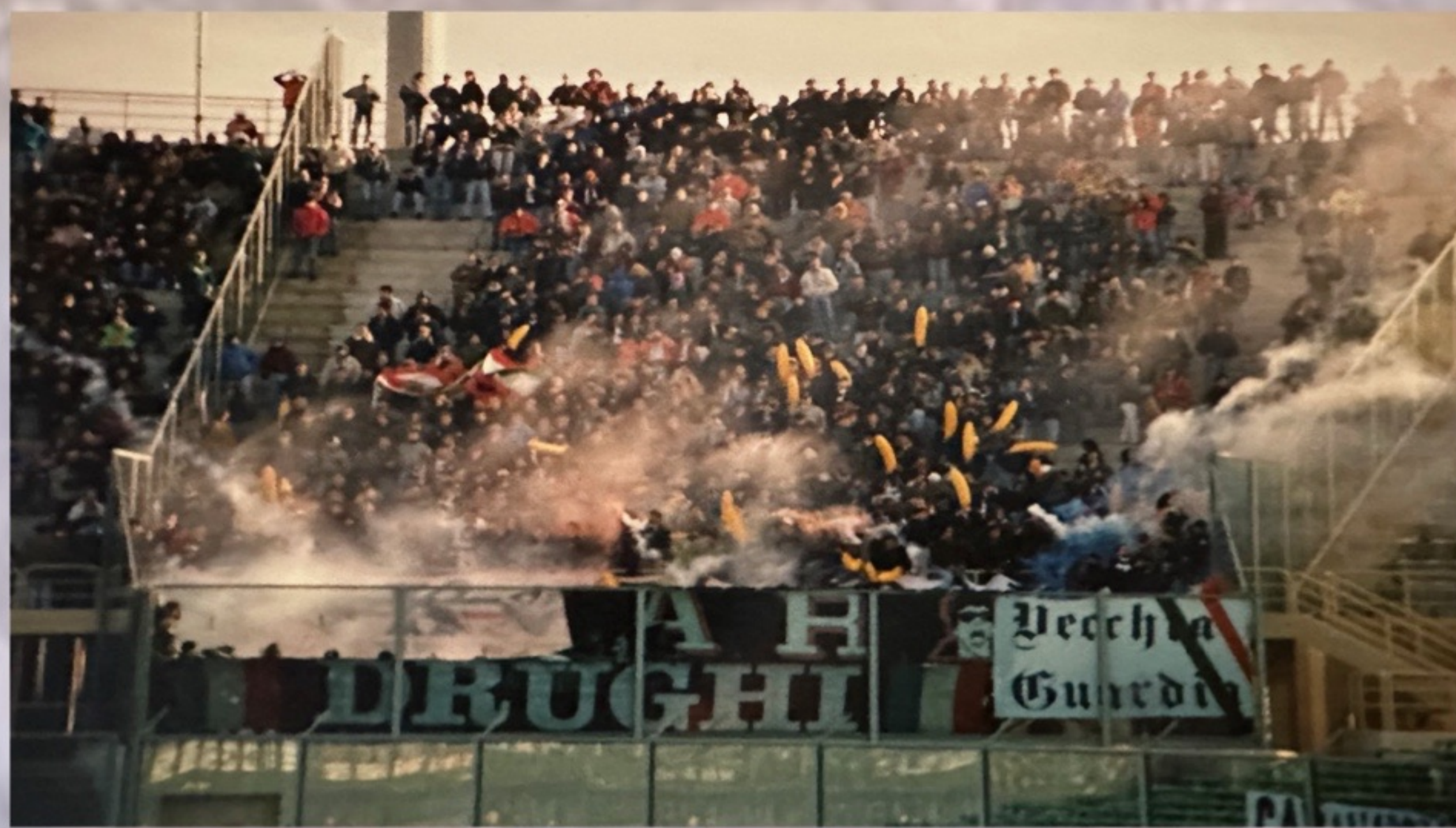
FIORENTINA - JUVENTUS 1992/93