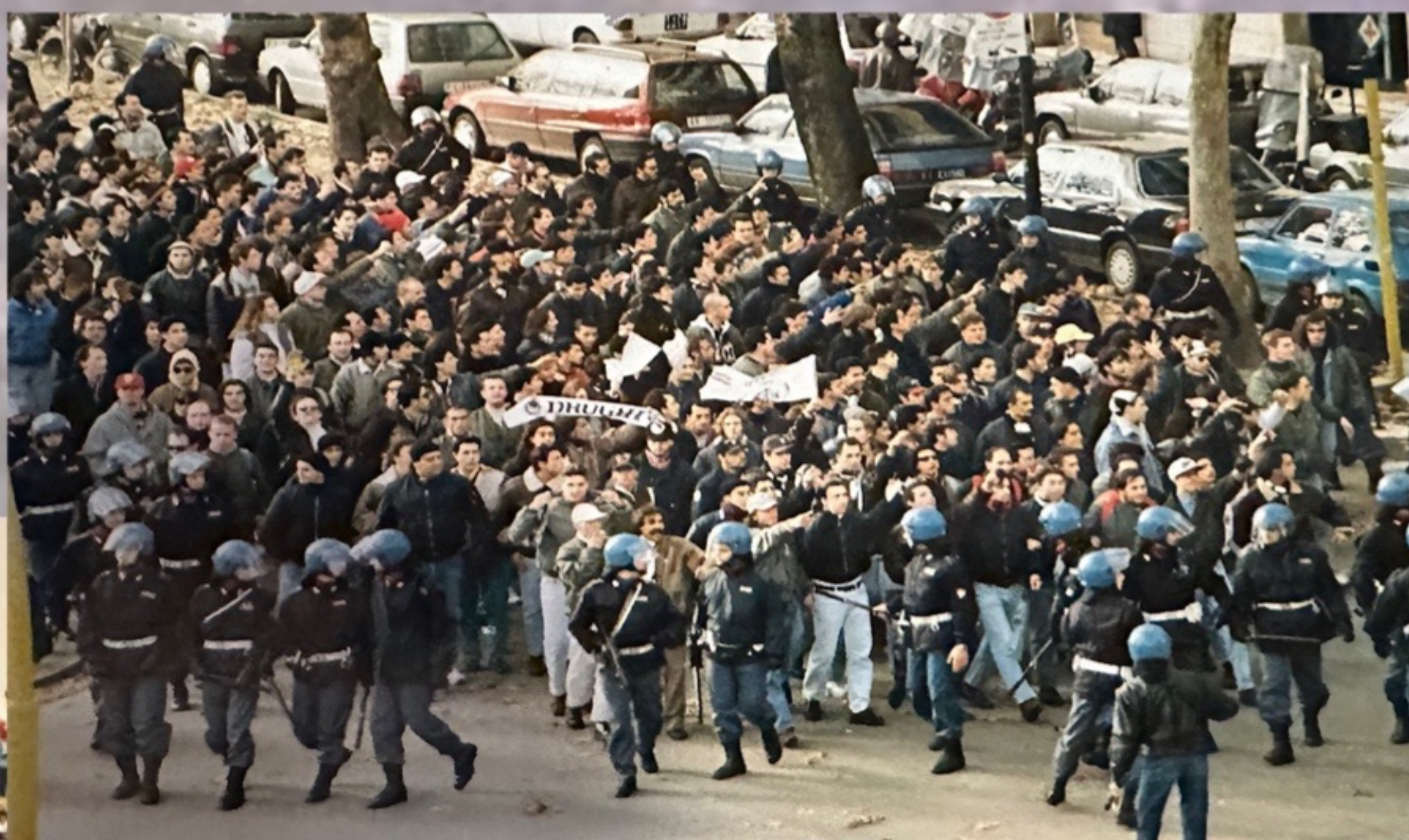
FIORENTINA - JUVENTUS 1992/93