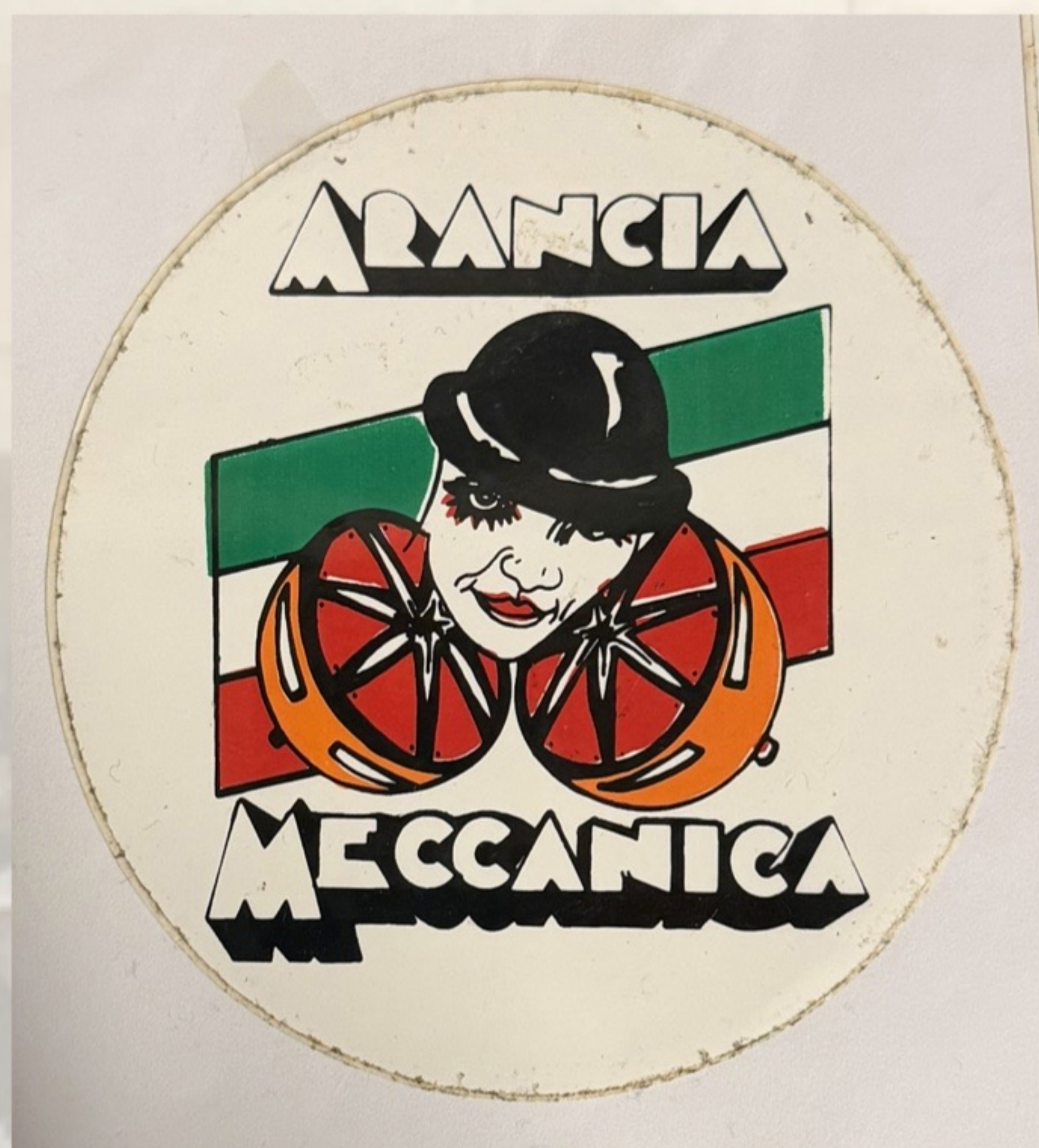
VECCHIO ADESIVO ARANCIA MECCANICA