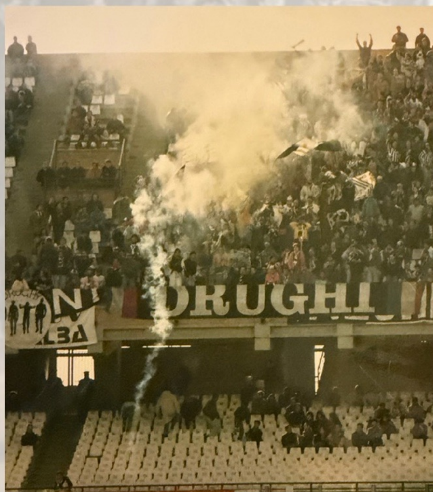
CAGLIARI - JUVENTUS 1991/92