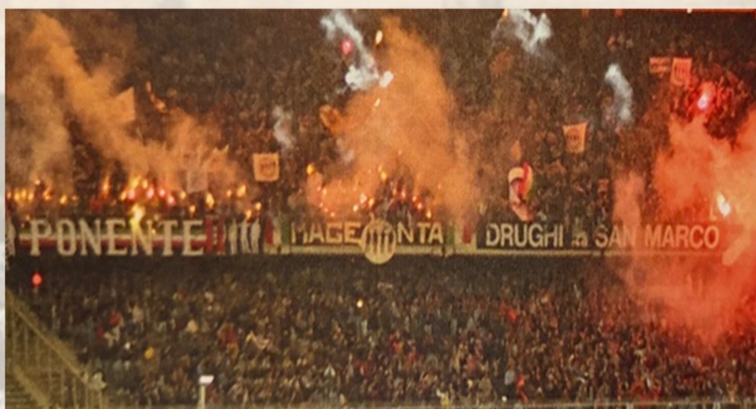
JUVENTUS - CAGLIARI COPPA UEFA 1994