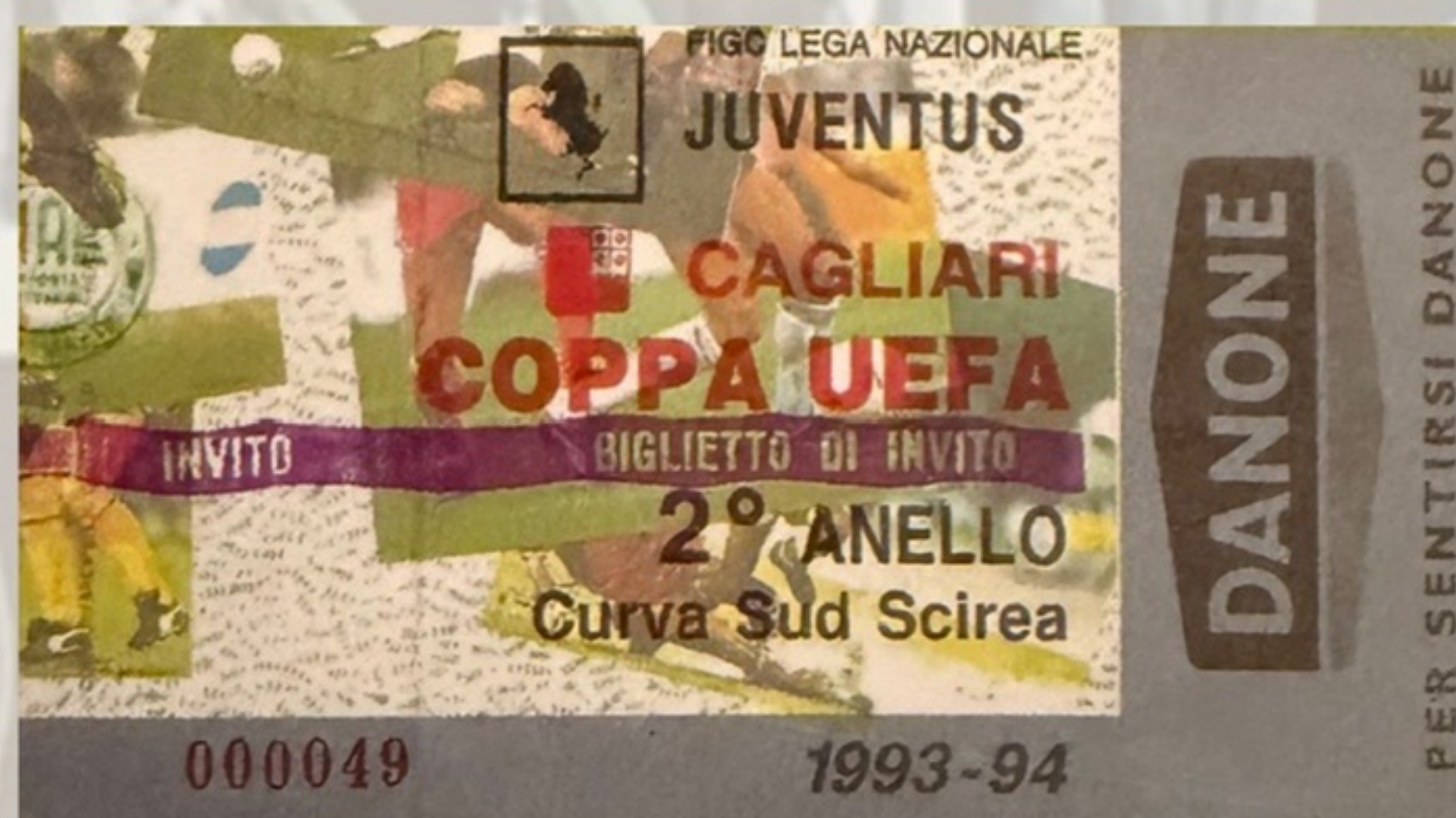
BIGLIETTO JUVENTUS - CAGLIARI COPPA UEFA 15/03/1994